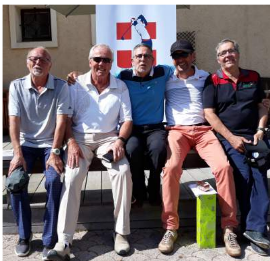
L'équipe de Mornex à Talloires :