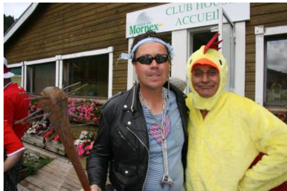
Pour gagner des points, faites "coin-coin" avec le dirlo...