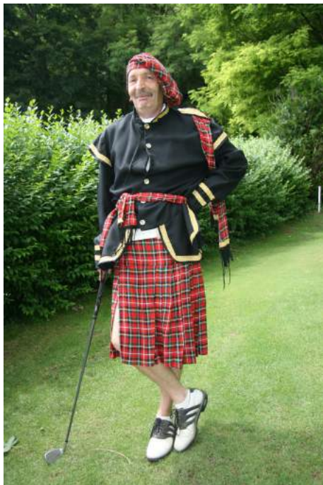
La prise de vue du bas vers le haut existe et sera dévoilée à la demande.....

Pour vous aider vous trouverez ci-dessous, comme dans la précédente newsletter quelques exemples de tenues: