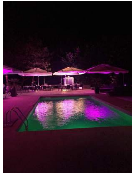
Floflo nous éclaire.....