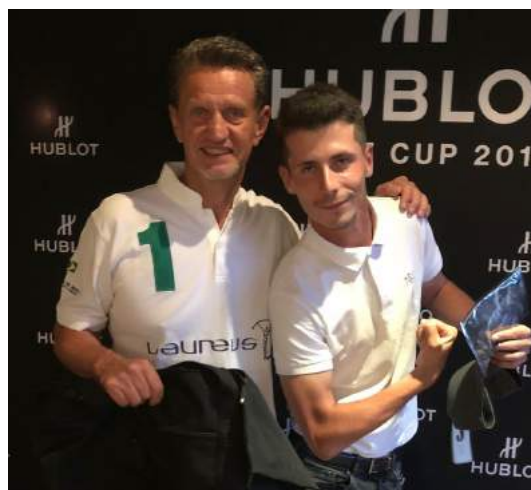
La force de frappe des vainqueurs: du muscle !